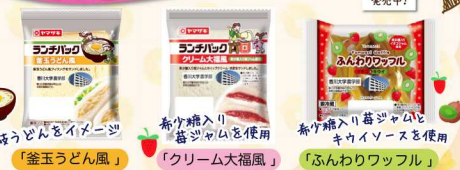
「釜玉うどん風」 「クリーム大福風」 「ふんわりワッフル」

山崎製パンさんとの共同企画が実現! 中四国内の国立大学としては初の試みです! In stores now! 中国の9県で発売中!