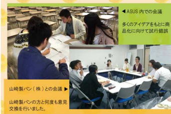
ASUS 内での会議 多くのアイデアをもとに商品化に向けて試行錯誤

また、農学部としての特色を生かすことを目指し、農学部で研究が行われている苺と希少糖に着目しました。その結果、希少糖入り苺ジャムを使用した【クリーム大福風ランチパック】が完成しました。上記のランチパック 2点と共に、希少糖入り苺ジャムとキウイソースを使用した【ふんわりワッフル】も商品化しています。3点とも中四国9県で発売中です。ぜひ食べてみてください。